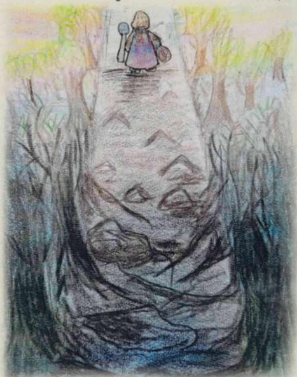
МБОУООШИ №1. КАЗАЧЬЯ