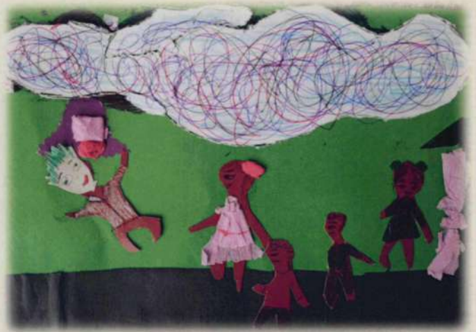
МБОУООШИ №1. КАЗАЧЬЯ