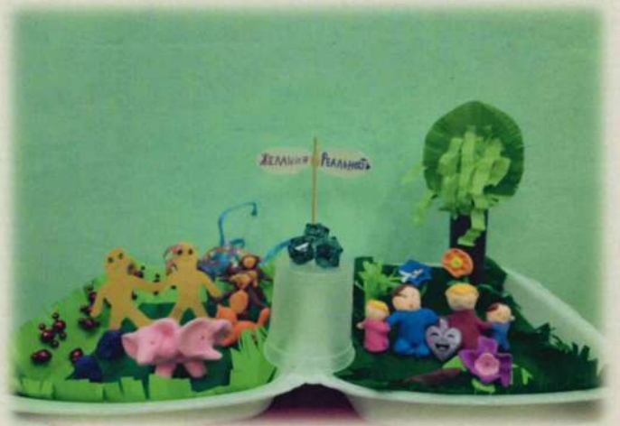
школа-интернат № 2 г. Армавира