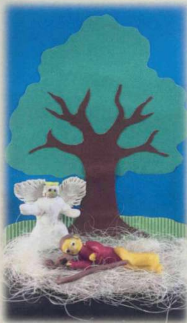
ГКОУ школа-интернат № 2 г. Армавира