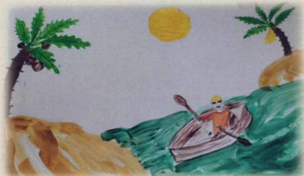
МБОУООШИ №1. КАЗАЧЬЯ

На корабле было шумно и грязно. Вот уже которые сутки он плыл в неизвестном ему направлении, как перед кораблем возник остров. Это был настоящий остров диких аборигенов, утопающий в зелени множества экзотических растений, и страннику почему-то верилось, что его встретят здесь обязательно дружелюбно. С каждым его путешествием страницы книги найти было все тяжелее, а подсказок почти не было. Он задумчиво стоял на пирсе, и вслушивался в свой внутренний голос, когда огромного роста человек подошел к нему и протянул страницу с какими-то древними надписями, которые он никак не мог понять. На обратной стороне, была, по-видимому, самодельно нарисованная карта. «Чтобы не заблудиться», - подумал он. Великан показал что-то жестами, и они отправились в глубь джунглей, чтобы на лодке добраться до ближайшего поселения. Полдня они плыли по опасной реке, кишасей всякой живностью, и только к вечеру причалили к деревне.