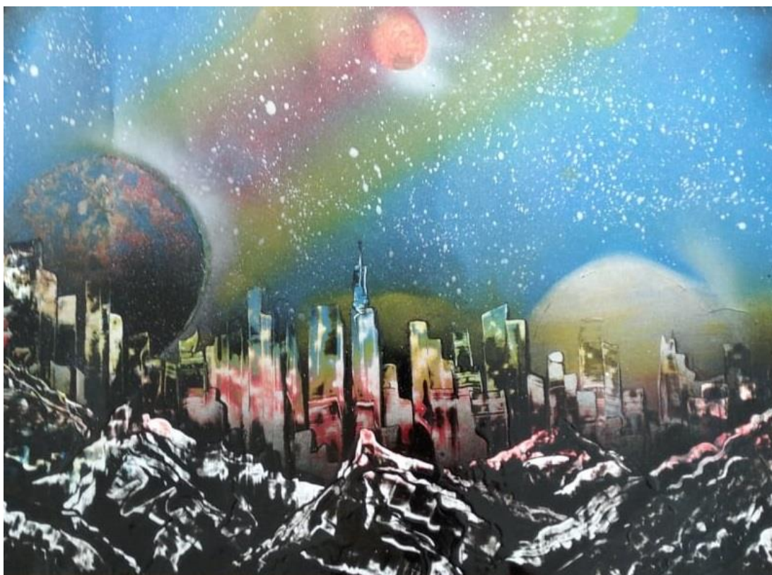
Рис. Ионов Демид

Из-за удара метеорита и отказа навигационной системы спасательная капсула корабля «Апполон» два дня дрейфовала в открытом космосе. Запасов провизии и кислорода осталось на неделю. Надеяться можно было лишь на чудо. Я и напарник молчали в ожидании неизбежного. Смотреть в